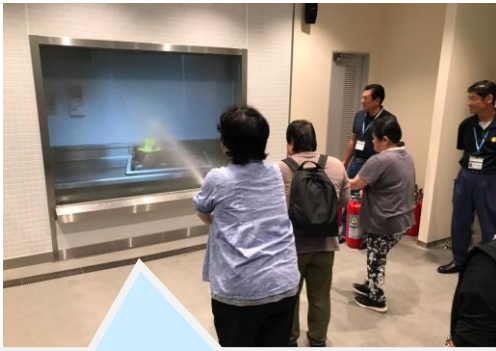
消火体験 シミュレーション